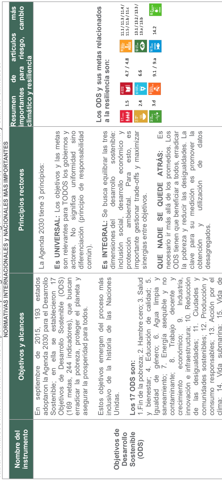
Tabla 1: Marcos internacionales más importantes para gestión del riesgo de desastres, resiliencia y cambio climático. NORMATIVAS INTERNACIONALES y NACIONALES MÁS IMPORTANTES

El marco legal que se presenta a continuación, resume los puntos más relevantes de los instrumentos internacionales más importantes para los temas de gestión del riesgo de desastres, resiliencia y cambio climático. Estos instrumentos establecen los estándares en la materia y han sido todos adoptados y ratificados por México; con lo cual, forman parte del marco legal mexicano. Además, se presenta el resumen de las principales leyes nacionales y generales de la temática.